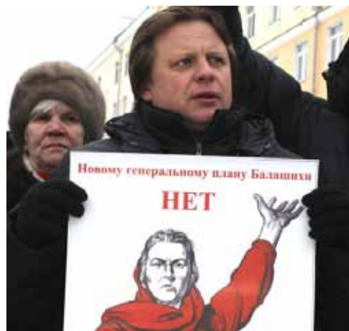
Жители мкрна «Заря» против нового Генплана