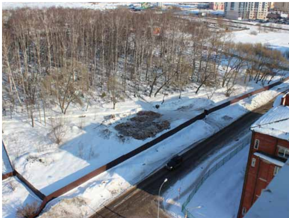
... а так - в реальной жизни

Реакция администрации, к изумлению обратившихся жителей, оказалась довольно оперативной. Не дожидаясь окончания официальных сроков, отведенных законом на составление ответа, чиновники выехали на место и вместе с жителями осмотрели территорию кладбища. Однако ответить на их вопросы так и не смогли, пообещав разобраться с происходящим в ближайшее время. Пока же жителям остается надеяться, что за это время у них под окнами не появится еще несколько молчаливых соседей.