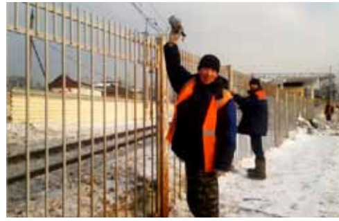
Гости из ближнего зарубежья перекрашивают заборы на ст. «Салтыковская» накануне визита врио губернатора