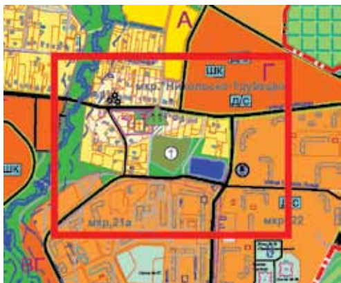
Так выглядят границы кладбища на Генплане...

Жители 21-го микрорайона Балашихи в скором времени могут лишиться не только прибрежной зоны реки Пехорки, где по новым градостроительным планам планируется построить несколько многоквартирных домов, но и последних участков зеленых насаждений, окружающих микрорайон. Они опасаются, что взамен кустарника прямо под их окнами появится широкая полоса свежих могил.