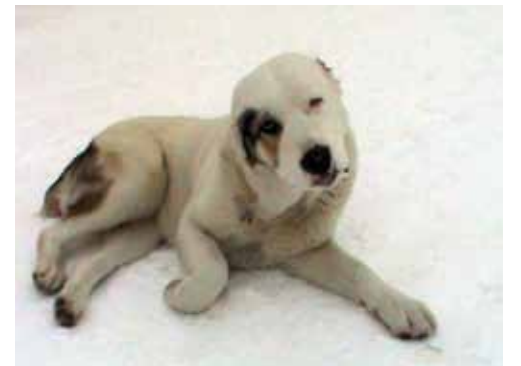
Этот алабай был жестоко убит человеком. После истязательств собака недолго продержалась, а ее труп был выброшен людьми на помойку

Непонимание этой прописной истины привело к тому, что появились целые сообщества догхантеров, то есть тех, кто травят или убивают собак, причем самым жестоким и кровавым способом.