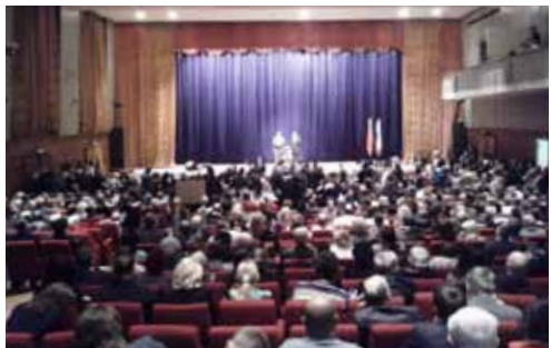
Больше тысячи человек собралось в ДК «Балашиха» на встречу с Андреем Воробьевым